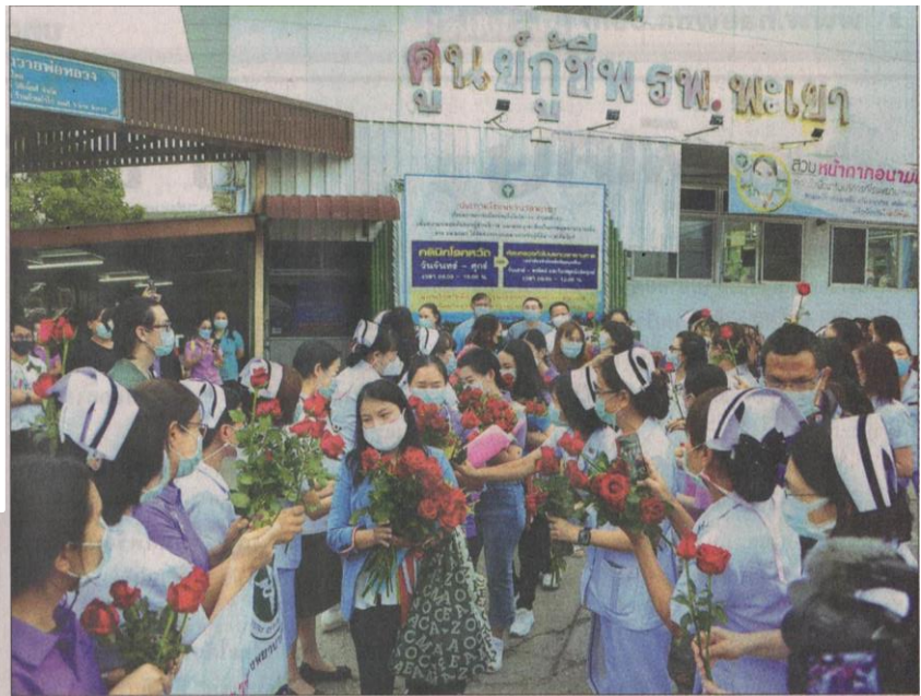
➤ ส่งมอบช่อดอกไม้ : เจ้าหน้าที่แพทย์ และพยาบาลโรงพยาบาลพะเยา ร่วมมอบช่อดอกไม้ให้กำลังใจทีมปฏิบัติการฉุกเฉินทางการแพทย์ในภาวะวิกฤติของโรงพยาบาลพะเยา จำนวน 8 คน ที่เดินทางไปปฏิบัติงานช่วยเหลือผู้ประสบภัยจากการระบาดของไวรัสโควิด-19 ที่โรงพยาบาลสนามบุษราคัม อิมแพ็คชาเลนเจอร์ เมืองทองธานี กรุงเทพฯ

ข่าวประจำวันศุกร์ที่ ๒๑ พฤษภาคม ๒๕๖๔ หน้าที่ ๑