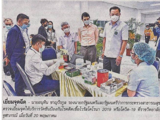
เยี่ยมจุดจัด - นายอนุทิน ชาญวีรกูล รองนายกรัฐมนตรีและรัฐมนตรีว่าการกระทรวงสาธารณสุข ตรวจเยี่ยมจุดให้บริการวัคซีนป้องกันโรคติดเชื้อไวรัสโคโรนา 2019 หรือโควิด-19 ที่ราชวิทยาลัยจุฬาภรณ์ เมื่อวันที่ 20 พฤษภาคม

ข่าวประจำวันศุกร์ที่ ๒๑ พฤษภาคม ๒๕๖๔ หน้าที่ ๑