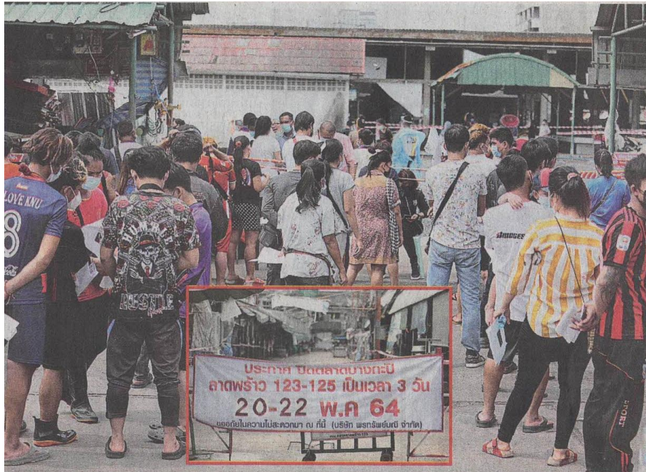
▲ ตรวจเชิงรุก ประชาชนกลุ่มเสี่ยงในเขตบางกะปิและกลุ่มผู้ค้าตลาดบางกะปิเข้าตรวจคัดกรองเชิงรุกหาเชื้อโควิด-19 ภายหลังจากสำนักงานเขตบางกะปิสั่งปิดตลาดบางกะปิ เนื่องจากพบว่ามีผู้ติดเชื้อไวรัสอินทรีย์ บริเวณตลาดชวงชอยลาดพร้าว 121 ถึงชอยลาดพร้าว 127 เป็นจำนวนมาก.

ข่าวประจำวันศุกร์ที่ ๒๑ พฤษภาคม ๒๕๖๔ หน้าที่ ๑